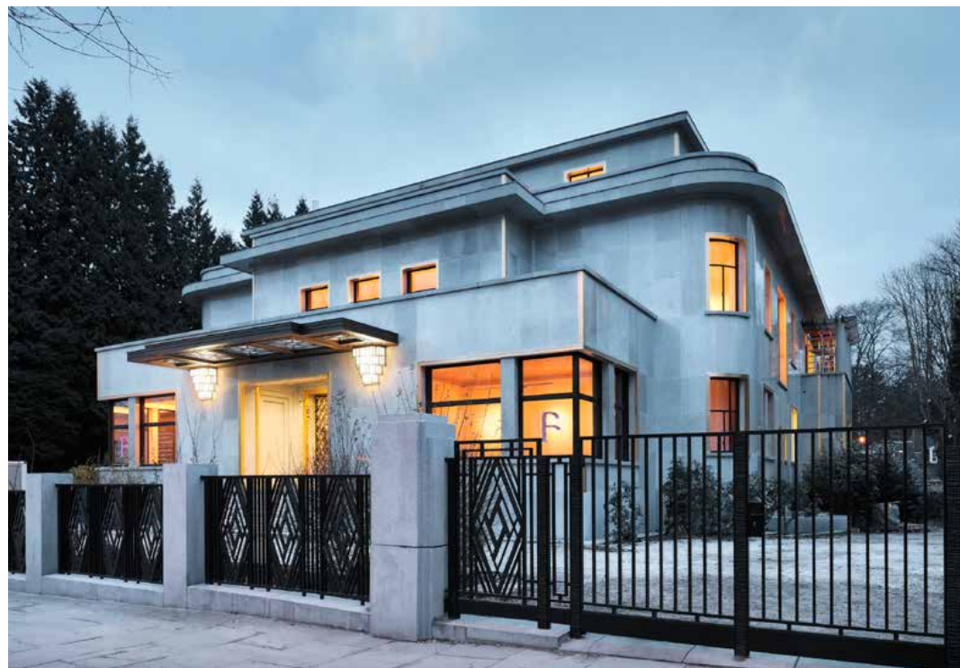
La Villa Empain

Arts décoratifs de La Cambre qui en prend la direction. Malheureusement, la guerre met prématurément fin aux activités du musée, la Villa étant réquisitionnée par l'Armée allemande en novembre 1943.