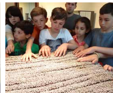
Atelier créatif organisé dans le cadre de l'exposition Quand le geste devient forme: Dansaekhwa et l'abstraction coréenne