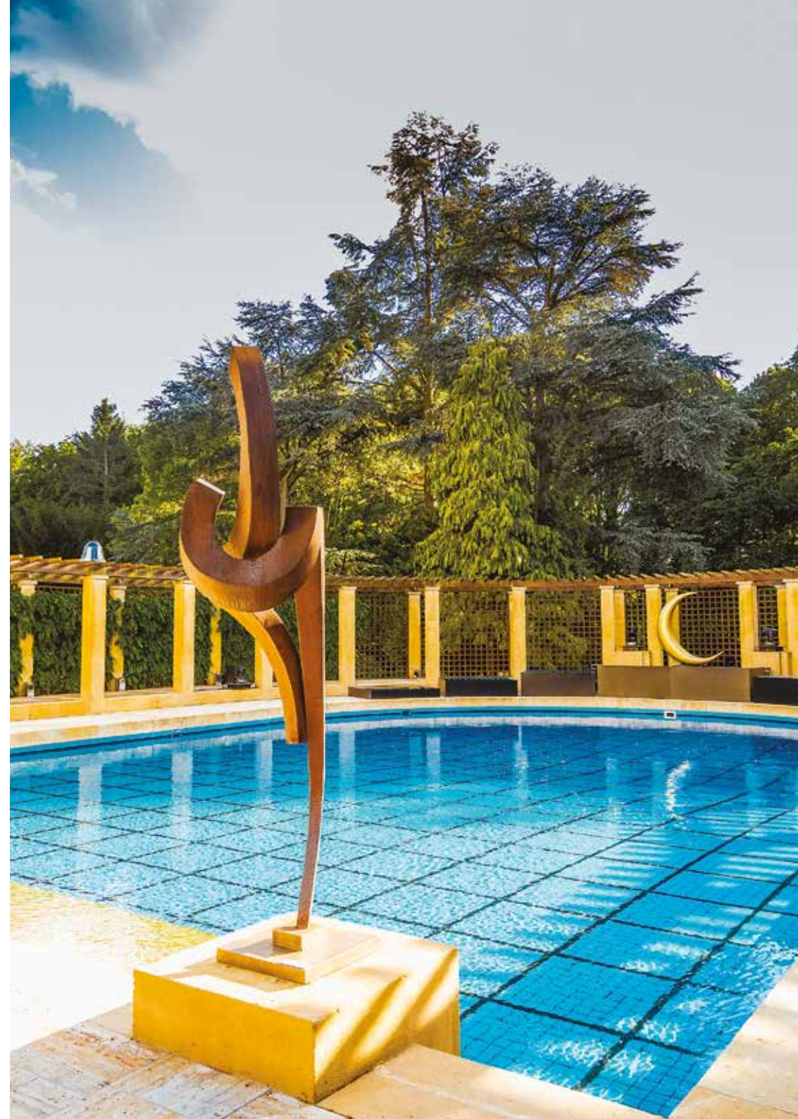
L'Appel van Johan Baudart, Tuin van de Stichting

Boghossianstichting communication@boghossianfoundation.be +32 2 627 52 30 Franklin Rooseveltlaan 67, 1050 Brussel