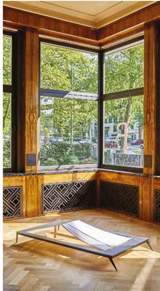
Image as Title door Nairy Baghramian. Tentoonstelling Répétition 2016

De tentoonstellingen in de Villa Empain laten de bezoekers nooit onverschillig. Ze worden georganiseerd in samenwerking met internationaal bekende curatoren en brengen werk van kunstenaars van heel uiteenlopende achtergronden.