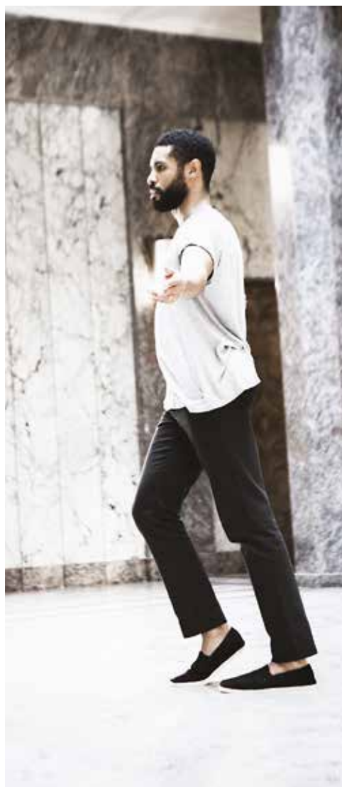
Andros Zins-Browne, Already Unmade , 2016

Soucieuse d'impliquer le public dans chaque aspect de la vie de la maison, la Fondation propose aux artistes en résidence de s'intégrer à la programmation de la Villa en présentant leur travail à ses visiteurs de façon dynamique et engageante. Ces rencontres entre artistes de tous horizons et public contribuent à l'ouverture du débat multiculturel.